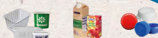
Plastmasas trauki un kastes