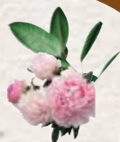
Ziedi un augi