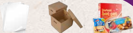
Papīrs (bez līmes/krāsas)

Jebko, kas ir mitrs vai slapjš, izmetiet zaļajā tvertnē