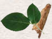
Lapas un koku mizas