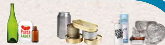
Stikla pudeles un burkas

Saplaciniet bundžas un plastmasas pudeles